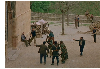
5. Varios milicianos en la Plaza de la Iglesia, donde apresarán al cura que disparaba desde la torre.