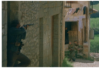
7. Otro momento del ataque, bajando por calle Virgen hacia las últimas casas.