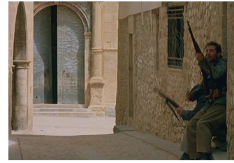
3. El ataque de los asaltantes avanza por la calle Iglesia hasta la iglesia de Santa Margarita desde cuyo campanario dispara el cura.