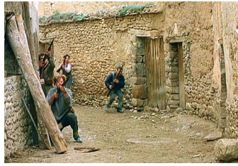
1. La milicia ataca el pueblo y el primer tiroteo se produce en la calle Nueva de Mirambel también conocida como calle del Ángel.