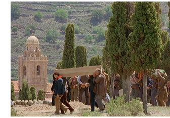
9. El entierro en el Calvario, un alto que mira hacia la torre de la iglesia y el casco urbano de Mirambel.