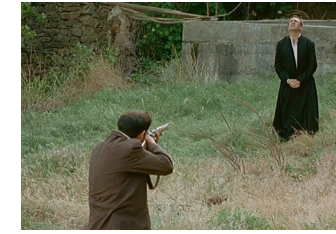
6. Fusilamiento del sacerdote en lo que se conoce como el Huerto del Secretario.