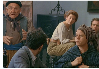
2. Escena de la colectivización en la Casa de los Julianes, en la calle Agustín Pastor.