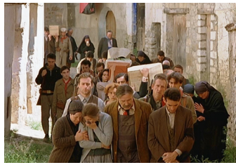
8. El cortejo fúnebre de los caídos baja desde la calle Rosario hasta la calle Virgen.